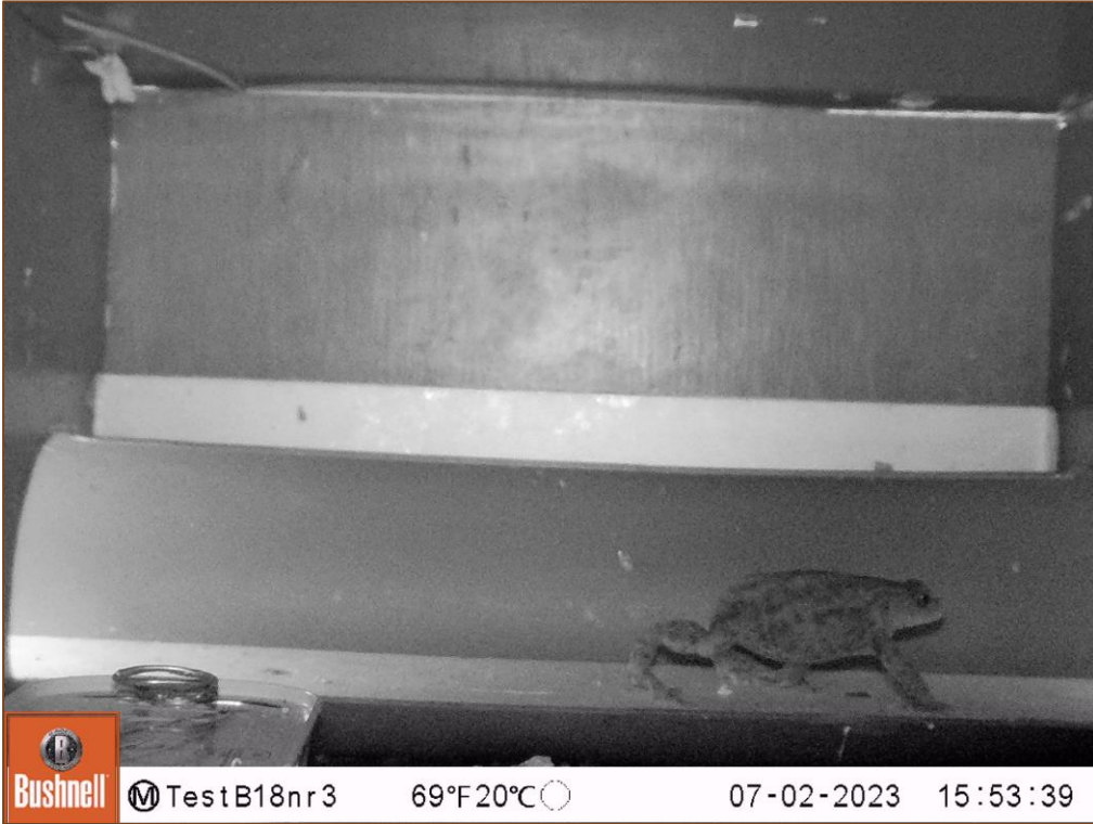
Foto 12. Gewone pad in de marterbox.