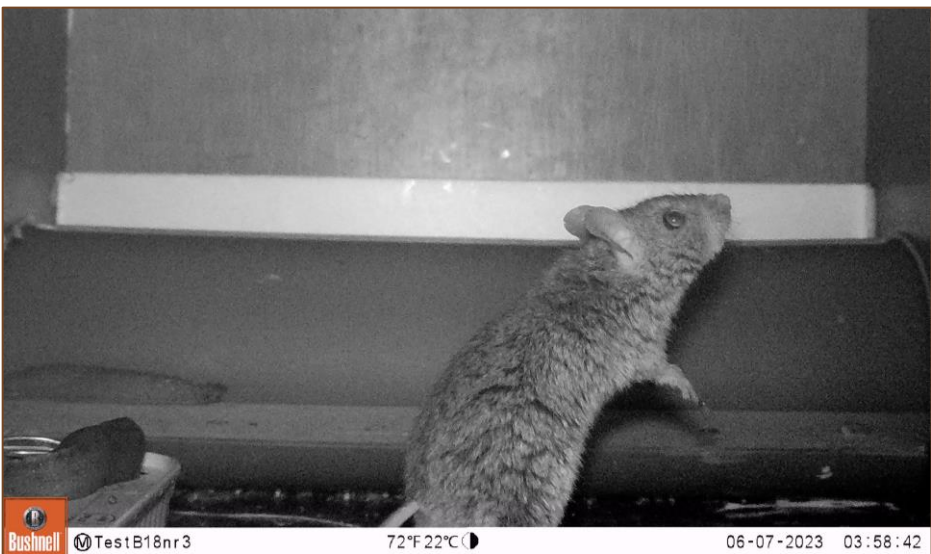
Foto 3 t/m 5. Selectie van camerabeelden van muizen vanuit de marterbox.