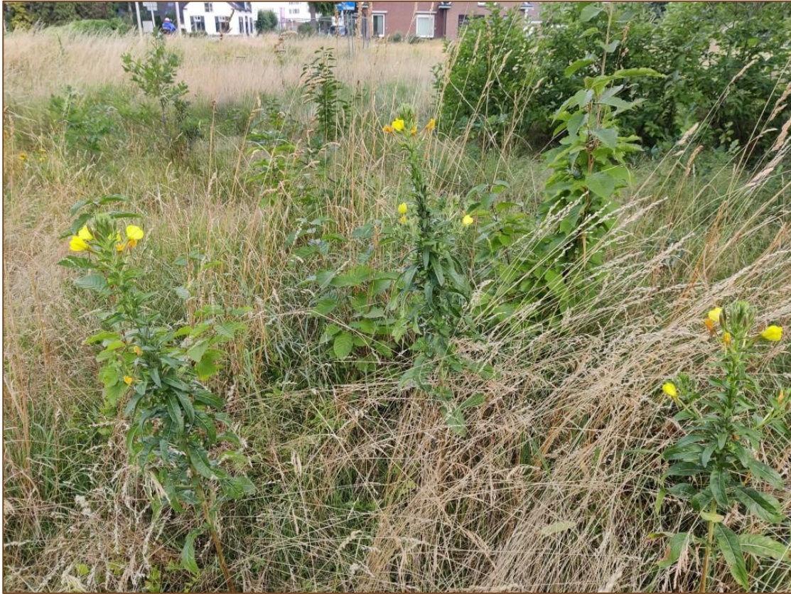
Foto 14. Groeiplaats van teunisbloemen in het plangebied (foto: R. Boerboom).