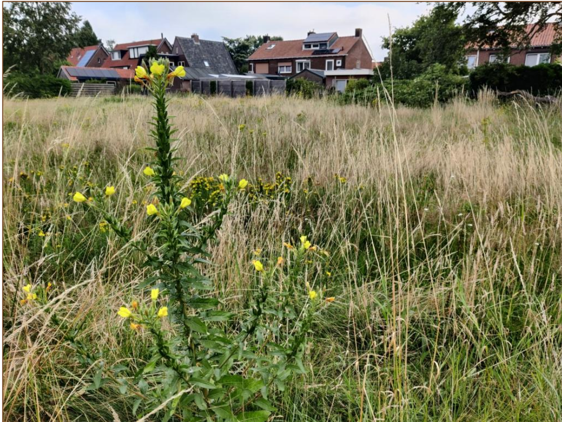
Foto 13. Groeiplaats van teunisbloemen in het plangebied.

Tijdens de eerste onderzoeksrunde zijn alle bloemstengels gecontroleerd op rupsen en sporen hiervan. Bij aanwezigheid van de rups van de teunisbloempijlstaart zijn namelijk vaak uitwerpselen zichtbaar op de bladeren en kunnen vraatsporen aangetroffen worden. De rupsen rusten overdag vaak tegen de bloemstengels aan, bovenin de stengel. Tijdens het eerste bezoek zijn geen rupsen van de teunisbloempijlstaart aangetroffen in het plangebied. Ook zijn geen sporen aangetroffen. Ook bij de teunisbloemen net buiten het plangebied zijn ook geen rupsen, of sporen hiervan, aangetroffen.