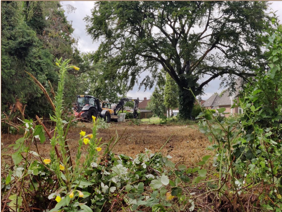
Foto 16. Klepelen van de vegetatie in het plangebied, inclusief de teunisbloemen op 3 augustus.

Tijdens de tweede controleronde was men bezig de vegetatie in het plangebied te klepelen en was een gedeelte van het plangebied waar de teunisbloemen stonden al geklepeld (zie foto 16). Alleen enkele teunisbloemen net buiten het plangebied waren nog intact, maar daarop zijn geen rupsen van de teunisbloempijlstaart, of sporen daarvan, aangetroffen. Er kon in het plangebied dus niet op aanwezigheid van rupsen gecontroleerd worden.