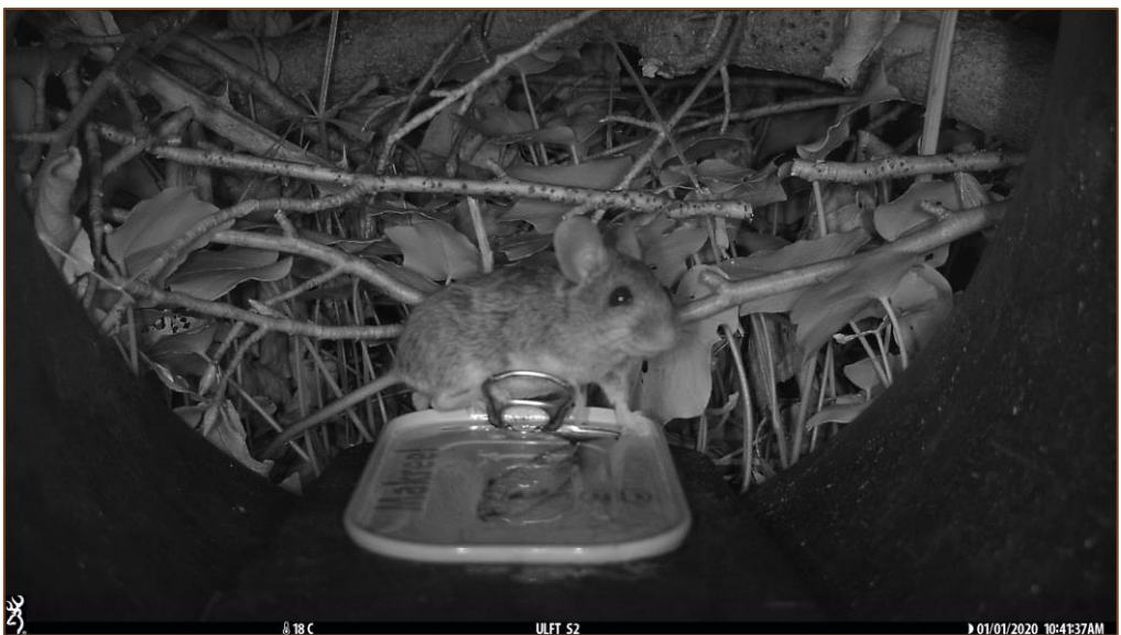
Foto 6 t/m 8. Selectie van camerabeelden van muizen vanuit de Struikrover cameraval.