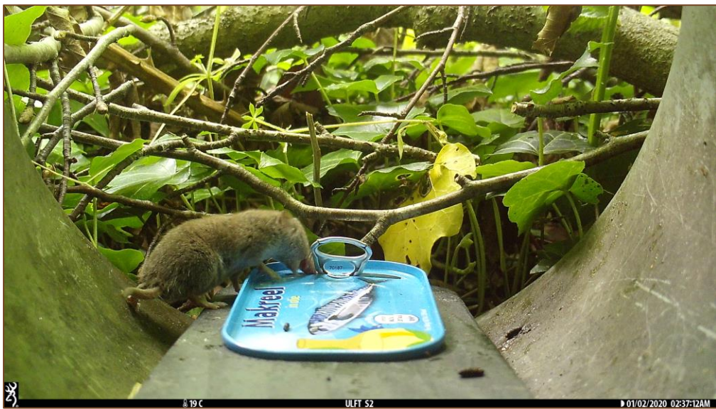
Foto 9 t/m 11. Selectie van camerabeelden van muizen vanuit de Struikrover cameraval.