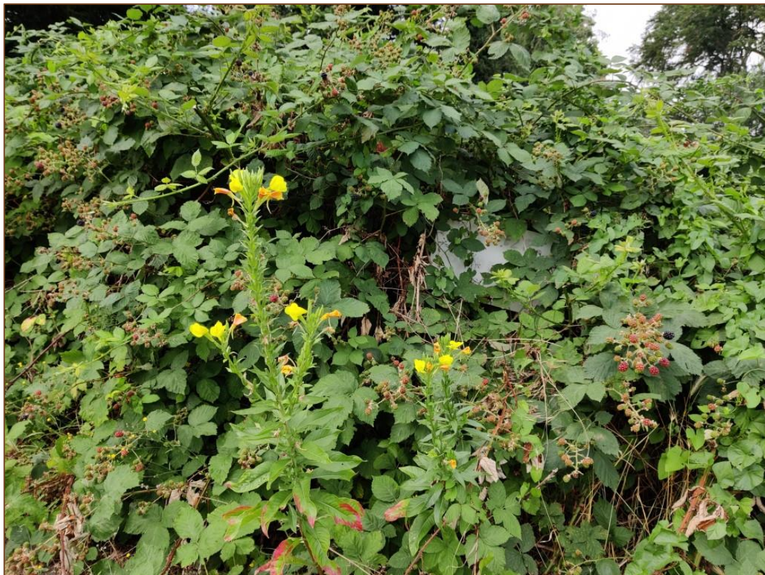
Foto 15. Groeiplaats van teunisbloemen aan de Frans Halsweg, net buiten het plangebied.