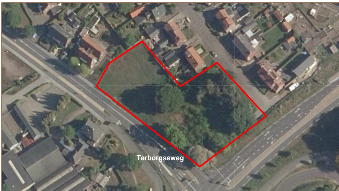
Figuur 1. Luchtfoto het plangebied (rood).

Ruimtelijke plannen kunnen conflicterend zijn met de Wet natuurbescherming, wanneer er sprake is van negatieve effecten op beschermde soorten. Het doel van het natuuronderzoek is om te inventariseren of er door de geplande ruimtelijke ontwikkelingen sprake is van aantasting van vaste rust- en verblijfplaatsen van de wezel en individuen van de teunisbloempijlstaart. Voor overige beschermde soorten zijn negatieve effecten op voorhand uit te sluiten, of zijn te voorkomen door rekening te houden met gevoelige perioden, zoals het broedseizoen.