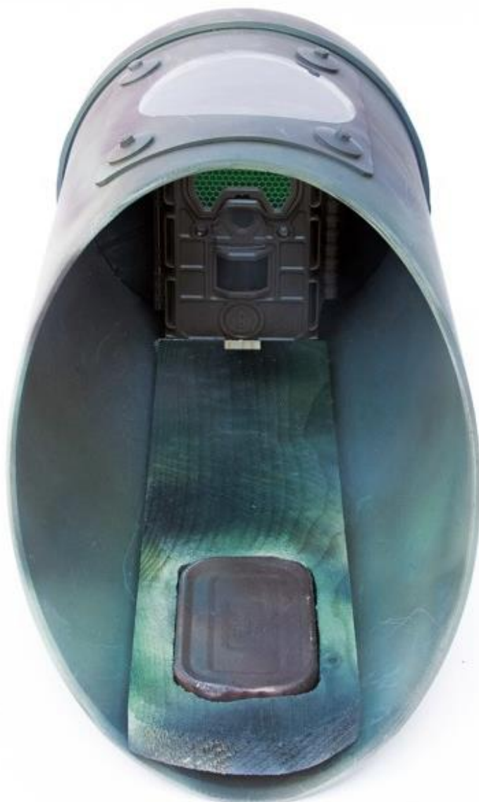
Foto 2. Voorbeeld van een Struikrover cameraval.